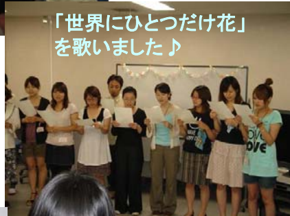
「世界にひとつだけ花」 を歌いました♪