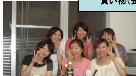
ホームステイではみんな 色々なことをして遊びました