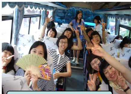
市内観光&病院見学