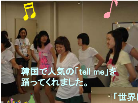
韓国で人気の「tell me」を 踊ってくれました。