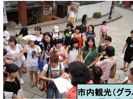
市内観光(グラバー園・大浦天主堂) 買い物(長崎駅・浜の町)